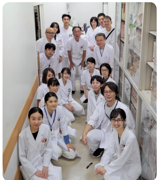
薬剤科のスタッフ

また、外来化学療法センターや治験支援室などにも薬剤師が配属されており、患者さんの治療を支えています。