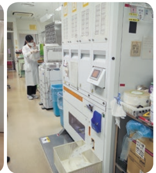
全自動錠剤分包機