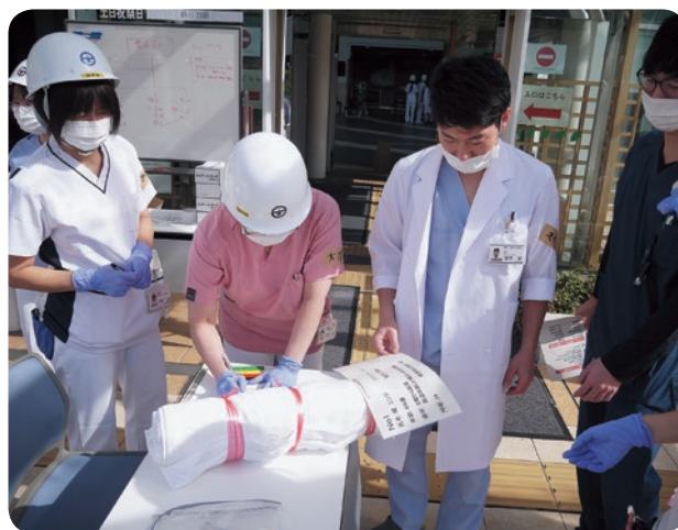
正面玄関でのトリアージ