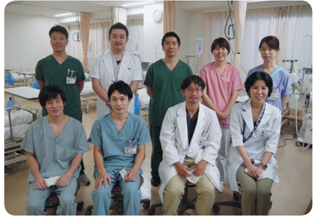
腎臓内科のスタッフ

液透析ですべての腎臓の機能を担うことは難しいのですが、日本の透析医療は非常に優れており、予後は良く、透析導入後も長生きする人が増えています。当院の治療では、血液透析を継続しつつ、生活の質も確保できるように努めていきます。