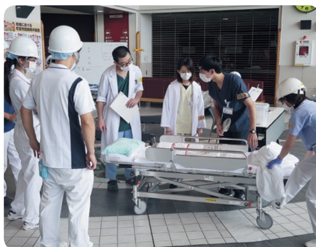
医師による症状の確認