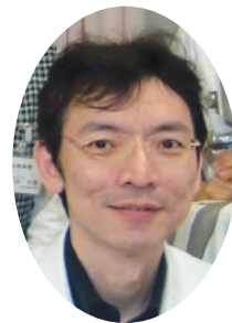
耳鼻咽喉科副部長