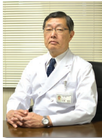
町田市病院事業管理者 町田市市民病院院長